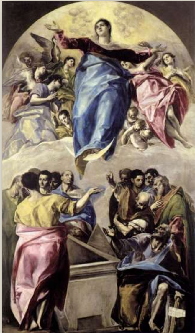
El Greco (Δομήνικος Θεοτοκόπουλος), The Assumption of the Virgin, 1577–1579