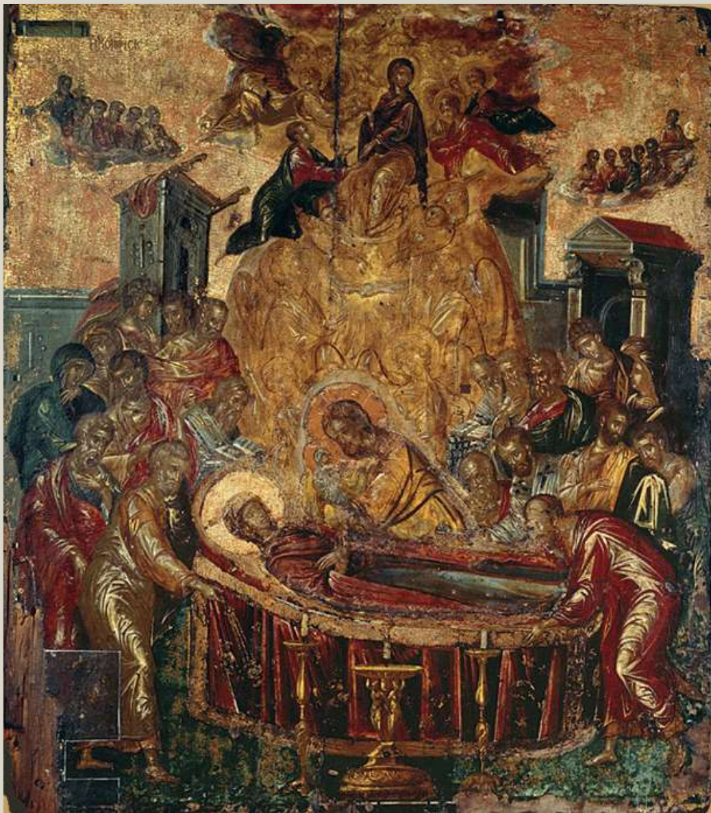
Δομήνικος Θεοτοκόπουλος «Η Κοίμηση της Παναγίας των Ψαριανών» , 1567, Εκκλησία της Κοίμησης της Παναγίας, Ερμούπολη